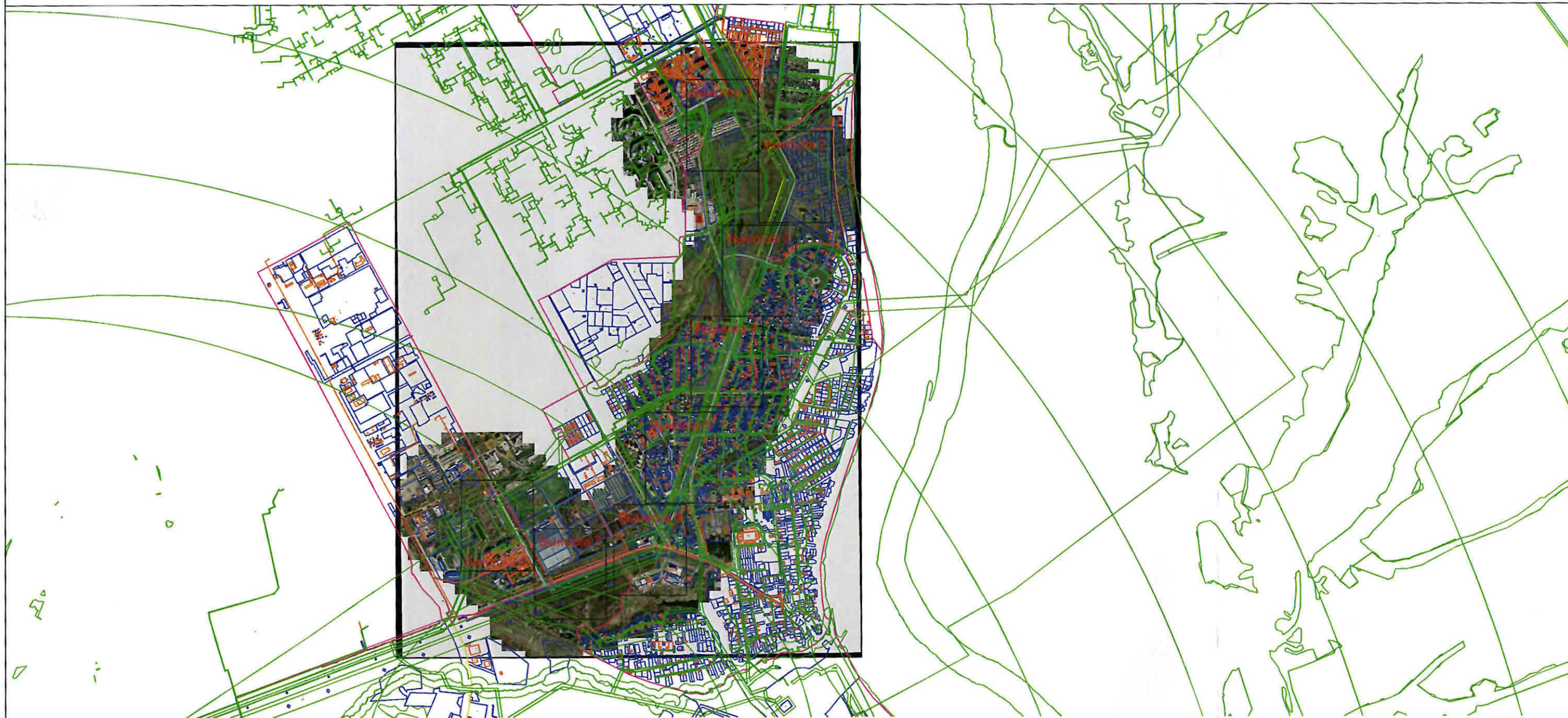
Схема расположения границ публичного сервитута, устанавливаемого в целях размещения (эксплуатации) "ВЛ 110 кВ Заискитимская-Восточная-1,2"

Используемые условные знаки и обозначения: